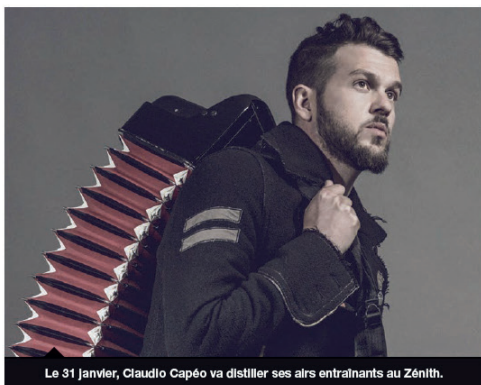
Le 31 janvier, Claudio Capéo va distiller ses alrs entraînants au Zénith.