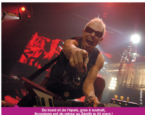
Du lourd et de l'épais, gras à souhait, Scorpions est de retour au Zénith le 23 mars !