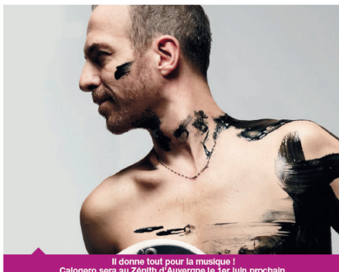
Il donne tout pour la musique ! Calogero sera au Zénith d'Auvergne le 1er juin prochain.