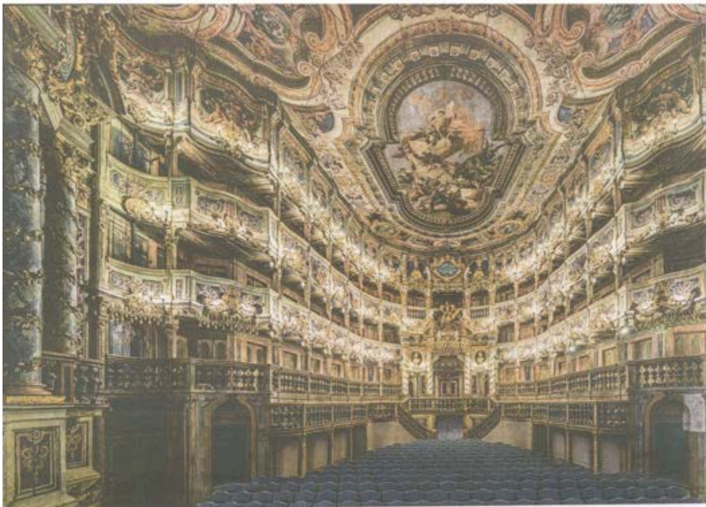
Šairnītas Baroka operas festivāla galvenā norises vieta ir Markgrāfistes teātris, kas ir viens no skaistākajiem baroka laikmeta teātriem Eiropā. Dzirēt operu kājā zālē ir īpaši pārdzīvojams, un visas bijētas uz izrādēm vienmēr ir pārdotas. Festivāla apsekitājums ir jāplāno laikam!