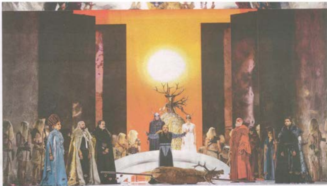
Šogad Baireitas Baroka operas festivāls tiks iestudēta Nikolas Antonio Porporas opera Ifigēnija Aulidā - tā nav skatījumi kopš pirmizrādes Londonā 1736. gadā. Šajā projektā Makss Emanuels Cenčičs uzpelnis gan režiju, gan Agamenona lomas izveidošanu.

koncertus. Makss Emanuels Cenčičs ir festivāla mākslinieciskais vadītājs. Ik gadu uz Baireitu tiek aicināts cits senās mūzikas orķestris, šoreiz tika piesaistīti divi starptautiski atzīti baroka ansambļi - Francijas Les Talens Lyriques Kristofa Rūsē vadībā un Itālijas Il Pomo d'Oro Frančesko Korti vadībā.